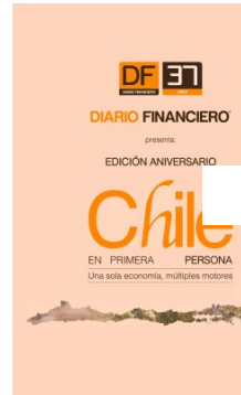
Portada Edición Aniversario