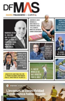
Portada DF MAS