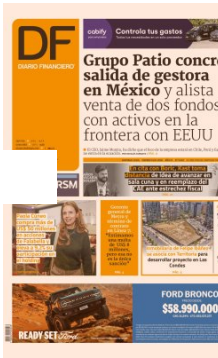
Portada Diario Financiero