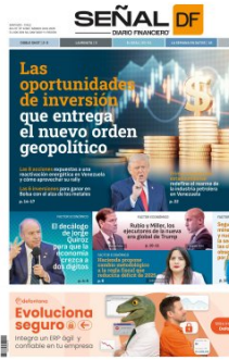
Portada Señal DF